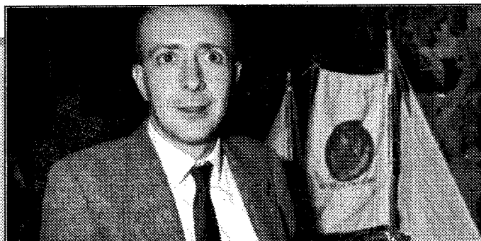
Il deputato Giovanni Ferro a destra Totò Cuffaro

Ma il governo di centrodestra non aveva promesso con solennità meno imposte per tutti?