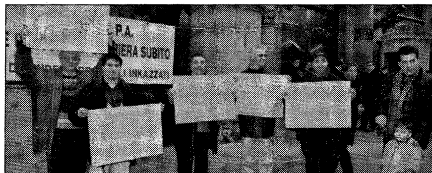
Una protesta dei "Regionali inkazzati"

Meno soldi ai trasporti, stop ai pensionamenti, sì ai precari